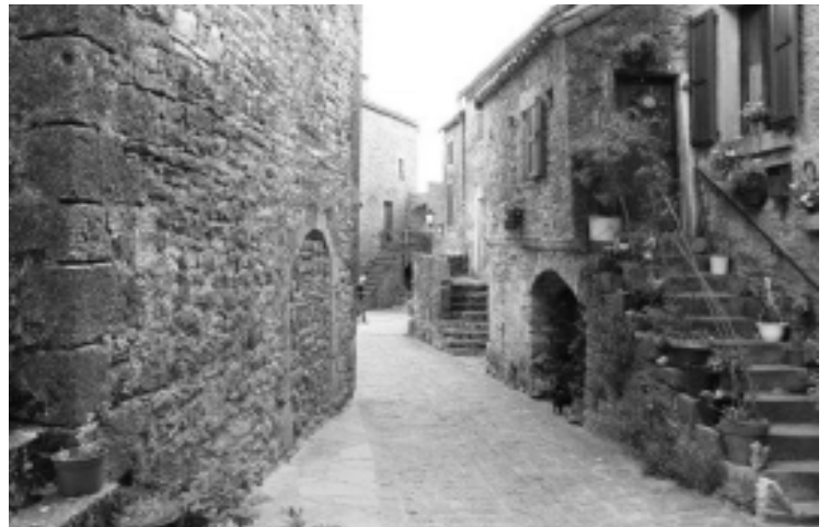
Une rue de Saint-Guilhem le Désert