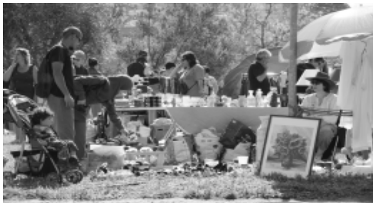
Précision : le petit garçon au premier plan n'est pas à vendre