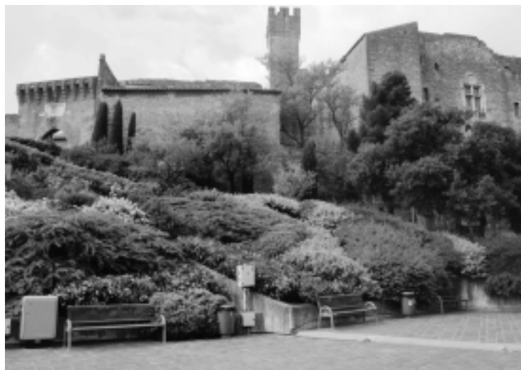
Vue splendide de l'ensemble du Château de l'Emperi

Les propriétés nombreuses du Savon Noir qu'il convient de découvrir ou redécouvrir.