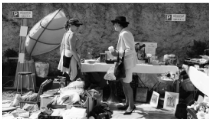
Votre casquette est jolie ! Votre chapeau n'est pas mal non plus. !