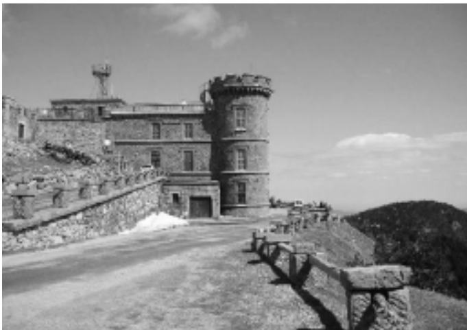
L'observatoire du Mont Aigual