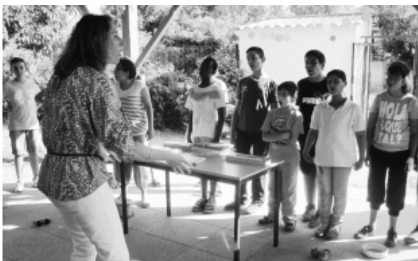
La chorale des Ecureuils et son animatrice