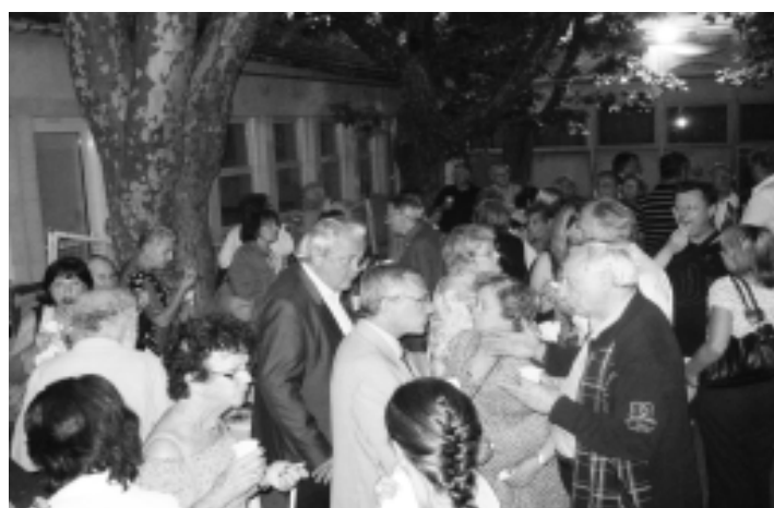
Vue du cocktail très animé dans la cour du Tempo. Merci encore à l'équipe qui l'a préparé et qui l'a servi