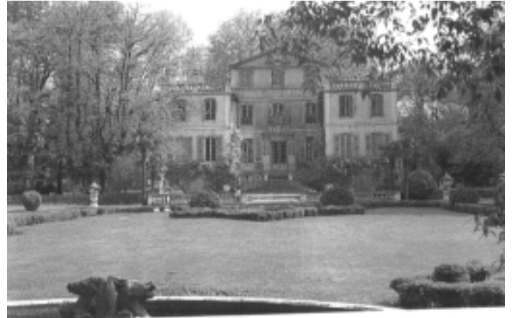
Vue du Château et du Parc de la Magalone