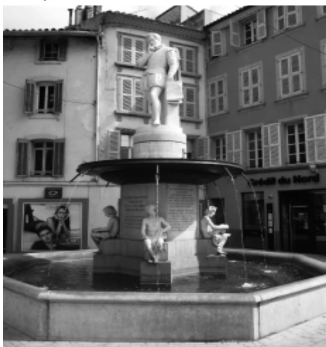
Statue d'Adam de Craponne à qui les villes de la région de Salon doivent tant pour leur alimentation en eau de consommation et d'irrigation.