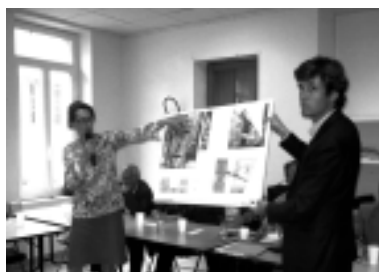
Présentation du projet de construction à la place du Tempo par l'Architecte et le représentant de la Ste Eiffage

Le projet immobilier présenté lors de l'Assemblée Générale du CIQ du 30 mai 2011 vient d'être abandonné-Il devait remplacer la Maison de Quartier Tempo par des immeubles d'habitation côté Av. de Mazague et côté Rue Thieux.