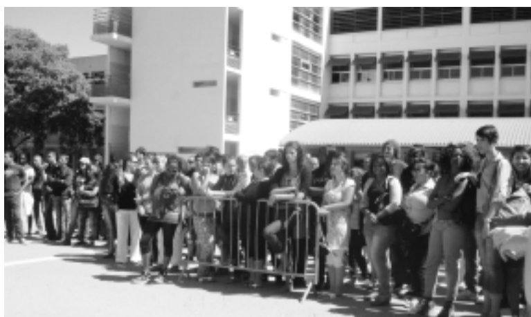
Nombreuse assistance des élèves tout autour