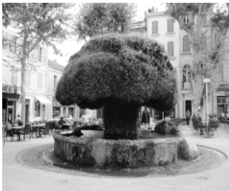
La fontaine moussue si emblématique de Salon.

En visitant régulièrement le site : ciq-sainteanne.fr , vous serez mieux informés.