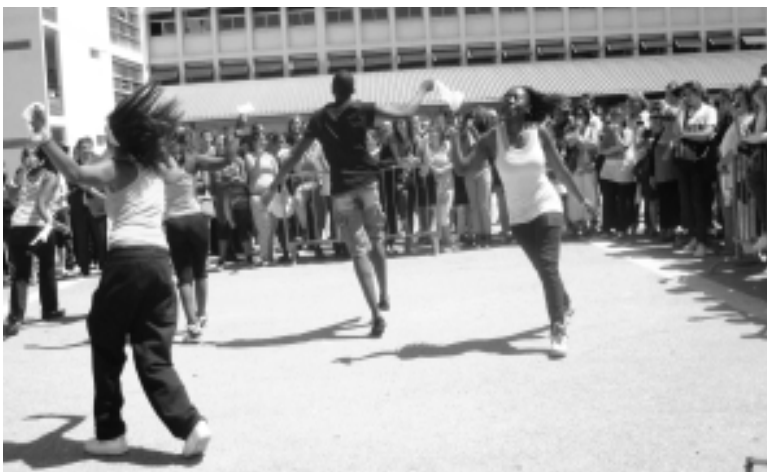
Démonstration de danse par les élèves du Lycée

Que peuvent bien se dire des anciens profs de Mistral qui se retrouvent par l'entremise du Président du CIQ ?